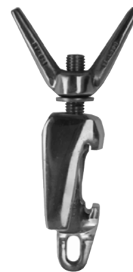
PALOMETA · WING NUT