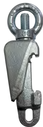
TUERCA DE OJO · RING NUT